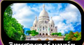
วิหารสกรเทอร์ มงมาร์ต