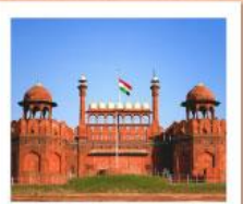
♥♥♥ Agra Fort