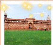
Ajmer Sharif Dargah