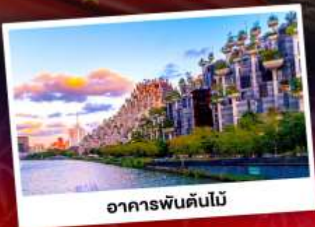
อาคารพันต้นไม้

ใกล้ชิดแพนด้าแดงแสนน่ารัก SHANGHAI WILD ANIMAL PARK ชมการแสดงพลุสุดปังที่สวนสนุกดิสนีย์แลนด์