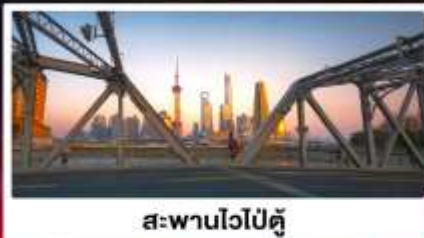
สะพานไวปู้ตู่