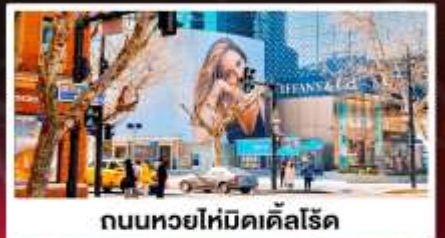
ถนนหยอไห่มีดเคิลโรด