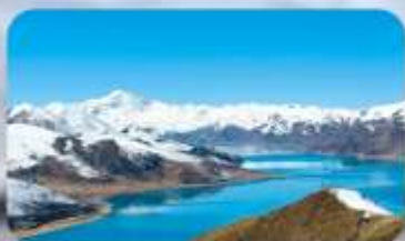
ทะเลสาบยิมครก