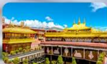
วัดโจกิง