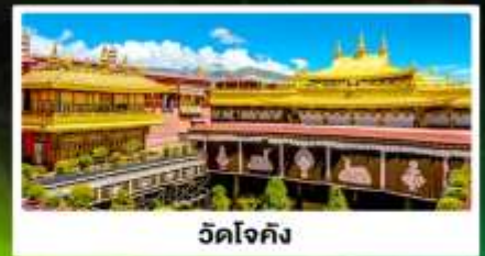
วัดโจกิง