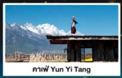
คาเฟ่ Yun Yi Tang