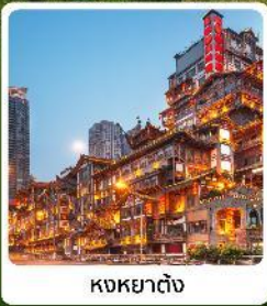
หงหยาดิง