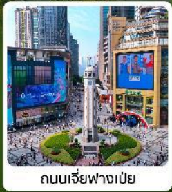
ถนนเจียฟางเป่ย์