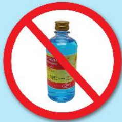
ขวดแอลกอฮอล์