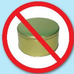
กล่องโลหะ