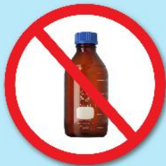
ขวดสารเคมี