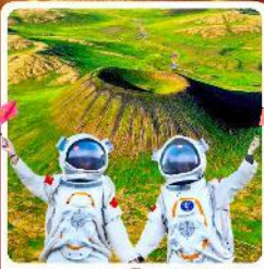
อุทยานภูเขาไฟอูลันฮาตา