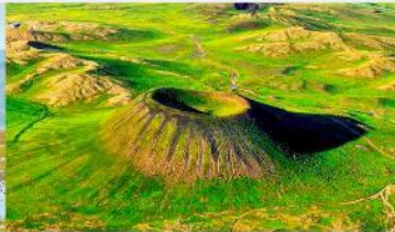
อุทยานภูเขาไฟอูลันฮาตา