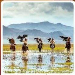
ชนเผ่ามองโกเลีย