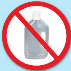
ขวดน้ำยา