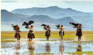
ชนเผ่ามองโกเลีย