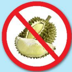
ผลไม้เขตร้อน ที่มีหนาม