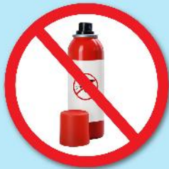
ขวดน้ำยา ฆ่าแมลง