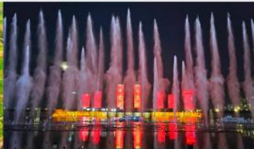
น้ำพุคังปาซี