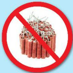
พลุ, ประทัด