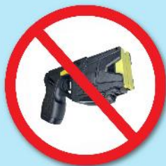
ปืนซ็อตไฟฟ้า