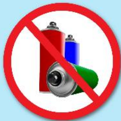
ขวดสเปรย์