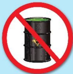
สารกัมมันตรังสี