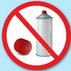
กระป๋องสเปรย์