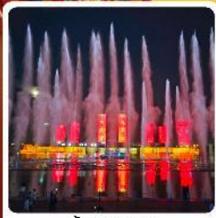
น้ำพุคังปาซี

● โอโหล้ เป็นทรายสีงาช้าง แหล่งท่องเที่ยวระดับ 5A ของจีน ภูเขาไฟอูลันฮาตา น้ำพุคังปาซี น้ำพุที่สูงที่สุดในเอเชีย