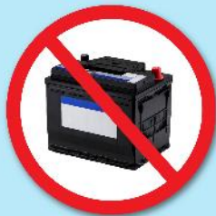
แบตเตอรี่ดำ