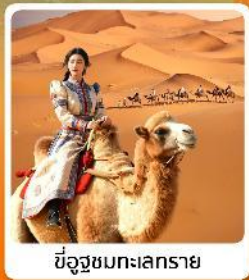
ขี่อูฐชมทะเลทราย