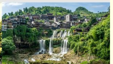
หมู่บ้านโบราณฟูหรงเจิ้น

*ทางบริษัทฯ ขอสงวนสิทธิ์ในการสลับโปรแกรมทัวร์ตามความเหมาะสมขึ้นอยู่กับสถานการณ์หน้างาน โดยคำนึงถึงผลประโยชน์ของลูกค้าเป็นสำคัญ