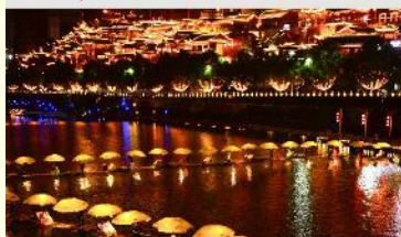
เมืองเซียนเอิน