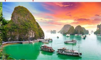
อ่าวฮาลอง

*ทางบริษัทฯ ขอสงวนสิทธิ์ในการสลับโปรแกรมทัวร์ตามความเหมาะสมขึ้นอยู่กับสถานการณ์หน้างาน โดยคำนึงถึงผลประโยชน์ของลูกค้าเป็นสำคัญ