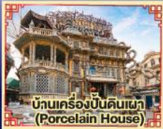
บ้านเครื่องปั้นดินเผา (Porcelain House)