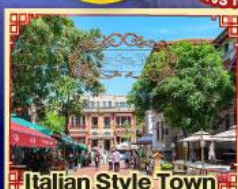
Italian Style Town