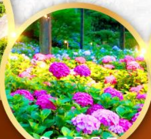
วัดมิมุโระโทจิ