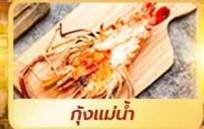
กุ้งแม่น้ำ