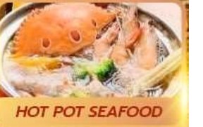
HOT POT SEAFOOD