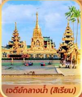
เจดีย์กลางน้ำ (สิริเยม)