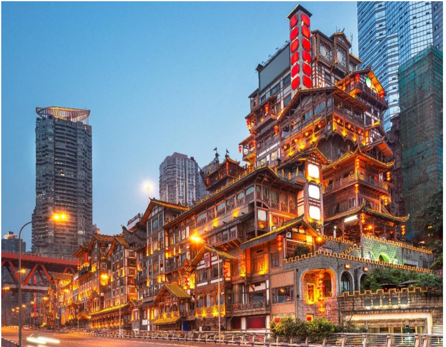
ค่ำ รับประทานอาหารค่ำ ณ ภัตตาคาร (มื้อที่ 4) เมนูพิเศษ สุกีซาบุม่าล่า

จากนั้นนำท่านสู่ หงหยาดัง คอมเพล็กซ์ในรูปแบบทรงอาคารโบราณขนาดใหญ่ ภายในมีร้านค้า ร้านอาหาร ร้านขายสินค้าที่ระลึก ฯลฯ ที่นี่ถือเป็นจุดนัดพบพักผ่อนของชาวเมือง และจุดชมวิวชั้นดี อีกทั้งยังเป็น จุดถ่ายรูปที่สำคัญของนักท่องเที่ยวอีกด้วย