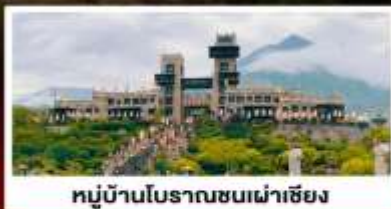
หมู่บ้านโบราณชนเผ่าเซียง