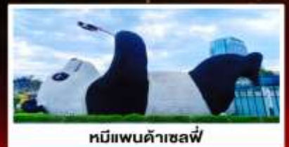
หมีแพนด้าเซลฟี่