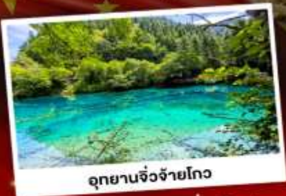
อุทยานจิ้งจายโกว