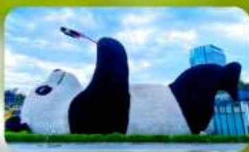
หมีแพนด้าเซลฟ์