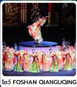
โชว์ FOSHAN QIANGQING