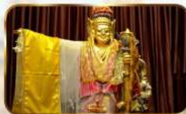
เทพทันใจโจ้เข้า