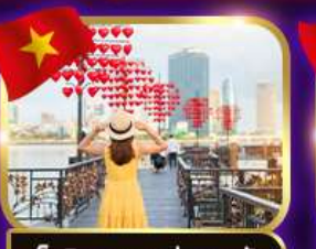
เช็คอินสะพานแห่งความรัก