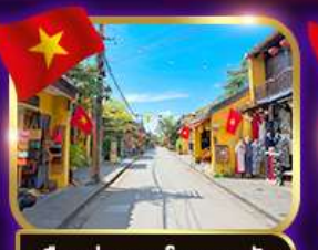
เมืองเก่ามรดกโลก ฮอยอัน