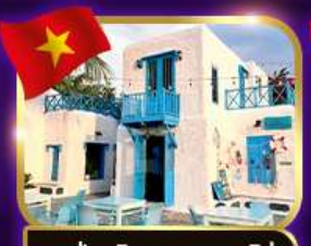
คาเฟ่สุดชิค ซานทรา มาริน่า