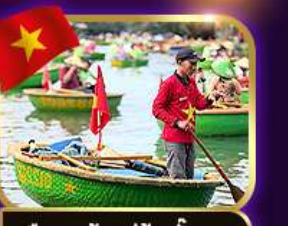
เรือกระด้ง หมู่บ้านก๊อบกาน