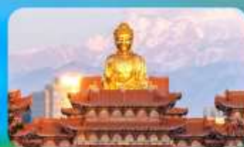
วัดพระใหญ่หวงกงชาน