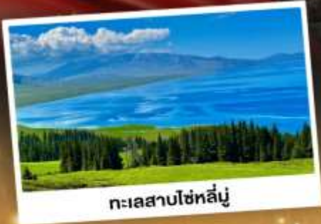
ทะเลสาบไซทาลีนู