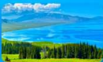
ทะเลสาบไซ่หลี่มู่