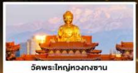
วัดพระใหญ่หวงกงซาน