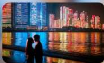
ชายหาดหมายเลข 3