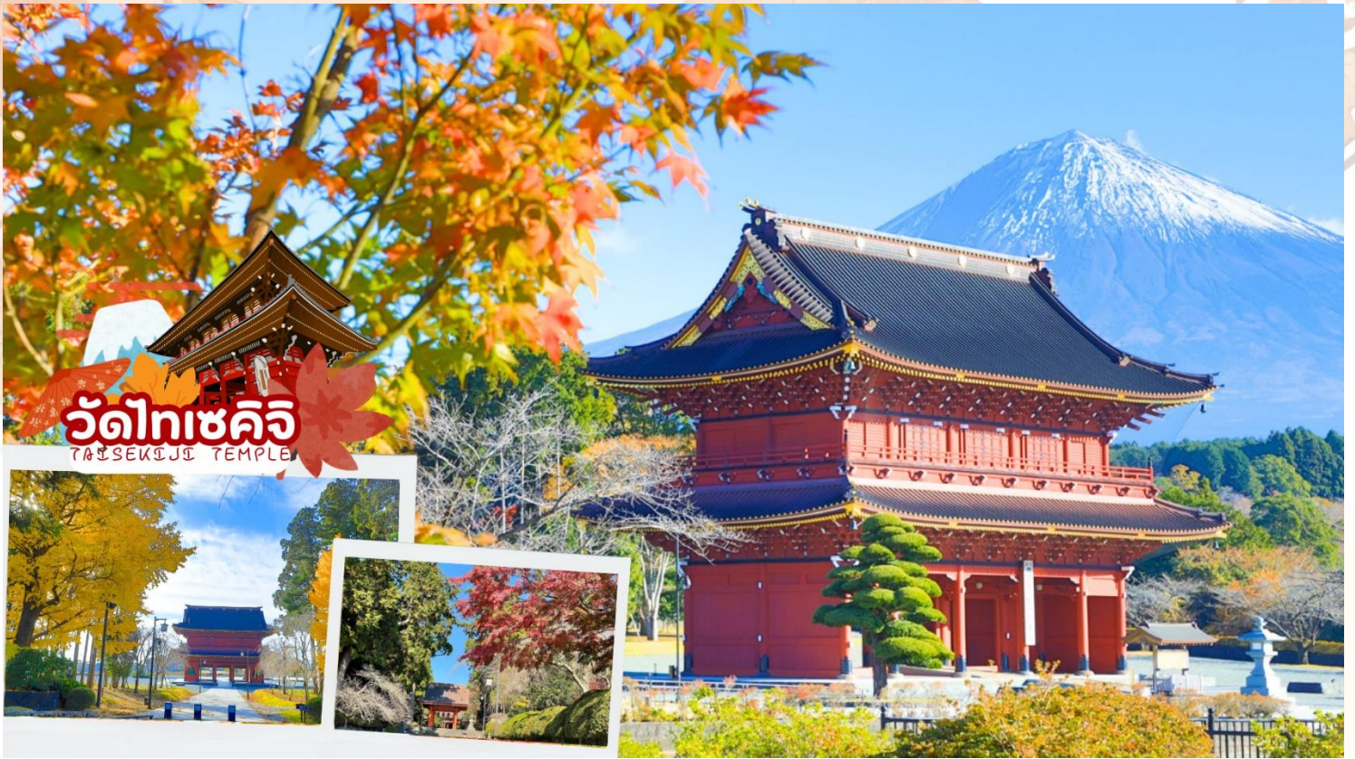
วัดไทเซคจิ TAISEKIJI TEMPLE

จากนั้นเดินทางต่อสู่ เมืองนาโกย่า เป็นเมืองที่มีประวัติศาสตร์มายาวนาน เป็นเมืองใหญ่ที่สุดในภูมิภาคจูบุ ซึ่งอยู่ตรงกลางของประเทศญี่ปุ่น มีสถานที่ท่องเที่ยวมากมาย ทั้งสถานที่ท่องเที่ยวทางประวัติศาสตร์ และสถานที่ท่องเที่ยวทางธรรมชาติ