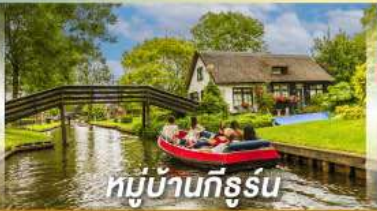
หมู่บ้านทึร์สุน