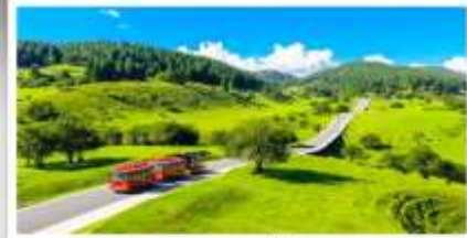
เวนางฟ้า

เดินทางโดย: สายการบินดงซิ่งเจียงเป่ย์ (PN)