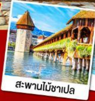
สะพานไม้ซาเปล