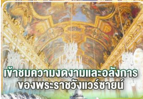
เข้าชมความงดงามและอลังการ ของพระราชวังแวร์ซายน์