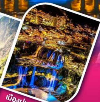
เมืองฝูหลงเจิ้น